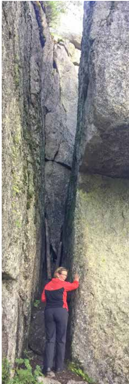
Melkoisia ”kallioleikkauksia” Lievestuoreen Hyökkäysvuorella.